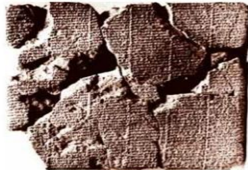
Արատտայի ճասին ամենամբրոջական պահպանված բնագիրը